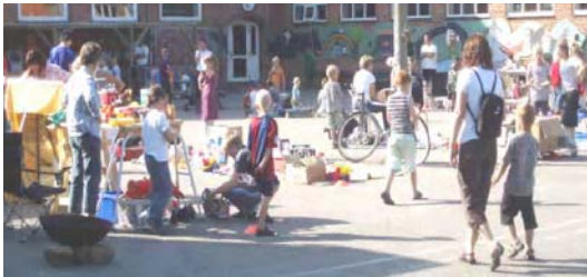
Vejret var som bestilt til lejligheden — en god dag til handel.

Som noget nyt solgte landsbylauget denne gang sodavand, is, pølser og pilsnere.