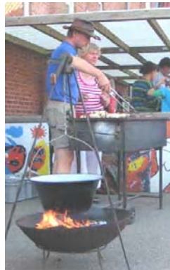
Der blev solgt både kogte pølser og ringriddere